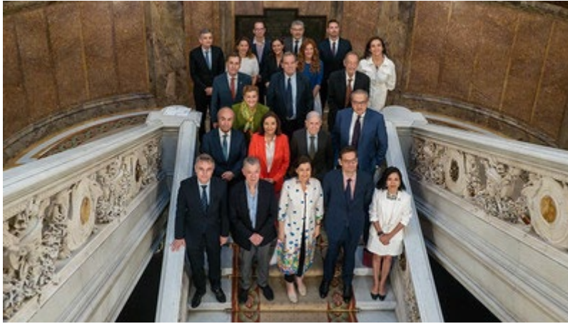
Foto familia. 4 de julio 2024