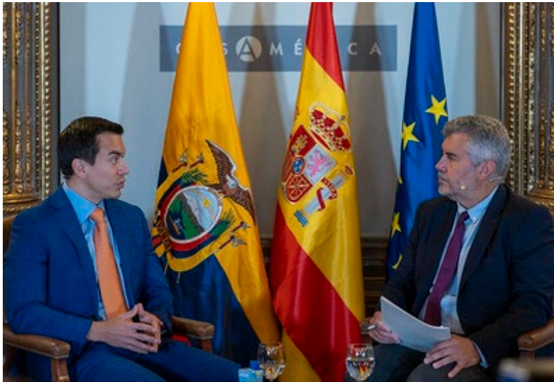
Daniel Noboa, presidente de Ecuador con Miguel Ángel Oliver, presidente de la Agencia EFE. 17 de mayo 2024.