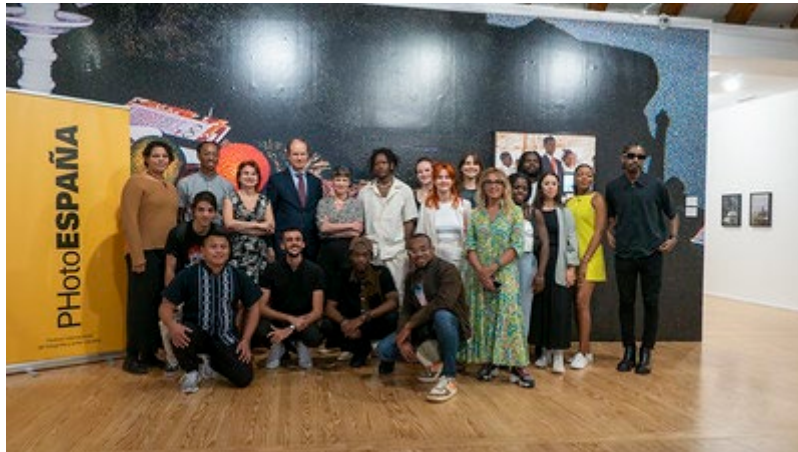
Foto inaugural exposición 31 de mayo a 7 de septiembre 2024. Participación de fotógrafos de varios países, incluyendo España y de países del Caribe como Belice, Cuba, República Dominicana, Bahamas, Trinidad y Tobago, Jamaica y Barbados.