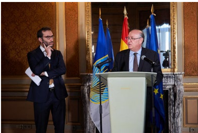
Carlos Cuerpo, ministro de Economía, Comercio y Empresa de España Y Ilan Goldfajn, presidente del Banco Interamericano de Desarrollo .30 de mayo 2024.